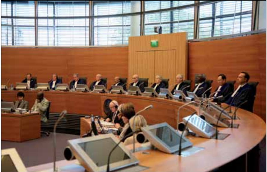
Sala de Controversias de los Fondos Marinos, Responsabilidades y obligaciones de los Estados patrocinantes de personas y entidades respecto de actividades en la Zona

Esta Sala está integrada por cinco miembros y dos suplentes. El Presidente y el Vicepresidente del Tribunal son miembros de la Sala por derecho propio.