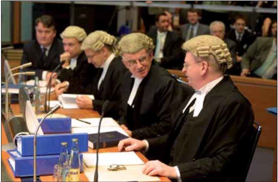
Asunto Planta MOX (Irlanda contra el Reino Unido)

Para más información sobre el procedimiento, véase la “Guía del procedimiento judicial ante el Tribunal Internacional del Derecho del Mar”, que se puede solicitar a la Oficina de Prensa y consultar en el sitio web del Tribunal en www.itlos.org .