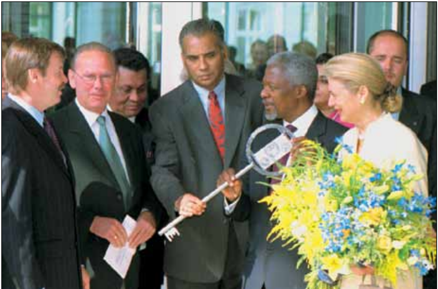
Presentación de la llave en la ceremonia de inauguración oficial del Edificio de la Sede del Tribunal el 3 de julio de 2000.

El 3 de julio de 2000, el Secretario General de las Naciones Unidas, el Excmo. Sr. Kofi Annan, inauguró oficialmente la Sede del Tribunal. El edificio está situado en Am Internationalen Seegerichtshof 1, en el distrito de Nienstedten en Hamburgo.