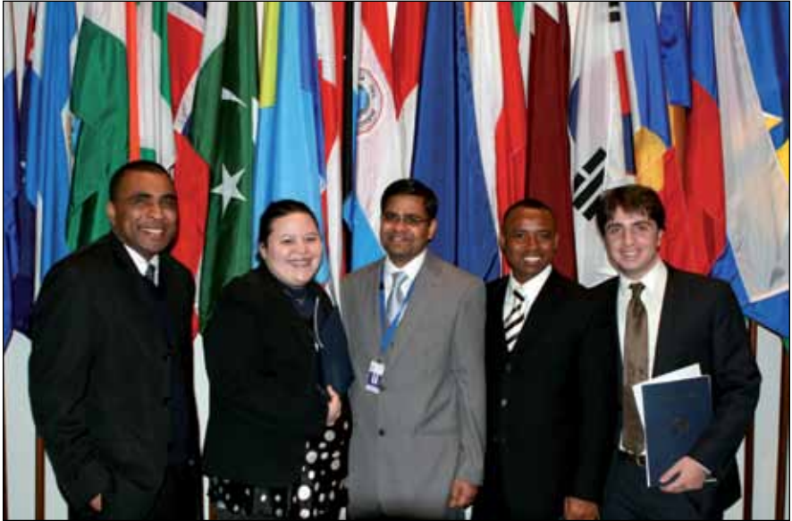
Participantes en el Programa de Nippon de 2009

diversos mecanismos de solución de controversias en virtud de la Convención y sobre la aplicación de la Convención en sus países de origen.