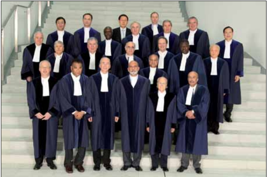
Magistrados del Tribunal Internacional del Derecho del Mar (2009)

El Tribunal se compone de 21 Magistrados elegidos por los Estados Partes en la Convención, con el concurso de una Secretaría (una secretaria internacional). El Tribunal tiene su sede en Hamburgo (Alemania). Sus idiomas de trabajo oficiales son el francés y el inglés.