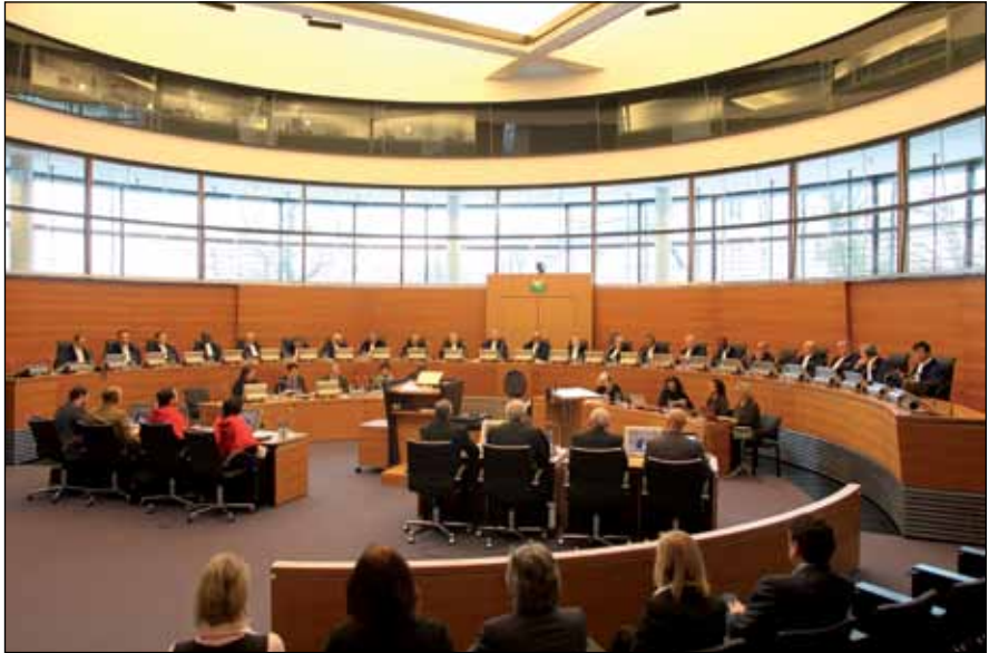
Causa del buque "Louisa" (San Vicente y las Granadinas contra el Reino de España)