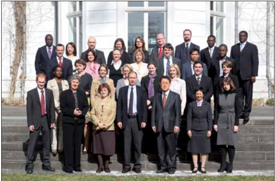
Personal del Tribunal (2011)

El Secretario está encargado de todos los trabajos jurídicos y administrativos, incluida la administración de las cuentas y finanzas del Tribunal. El Secretario es el conducto ordinario de las comunicaciones que recibe y despacha el Tribunal. Lleva el Registro de los asuntos y conserva copias de las comunicaciones y acuerdos de conformidad con el Reglamento.